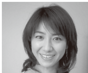
高田万由子 略歴：東京都生まれ。東京大学卒業。大学在学中、雑誌の表紙を飾ったのがきっかけで芸能界デビュー。ドラマ・CM・映画・舞台などを中心に女優として活躍。1999年「バイオリスト」の黒加瀬太郎氏と結婚。エッセイや絵本の翻訳、料理本などの執筆も手掛ける二児の母。

目的 日本の文化と環境問題に対する意識の高揚 参加対象 一般 募集定員 350名(事前申込)